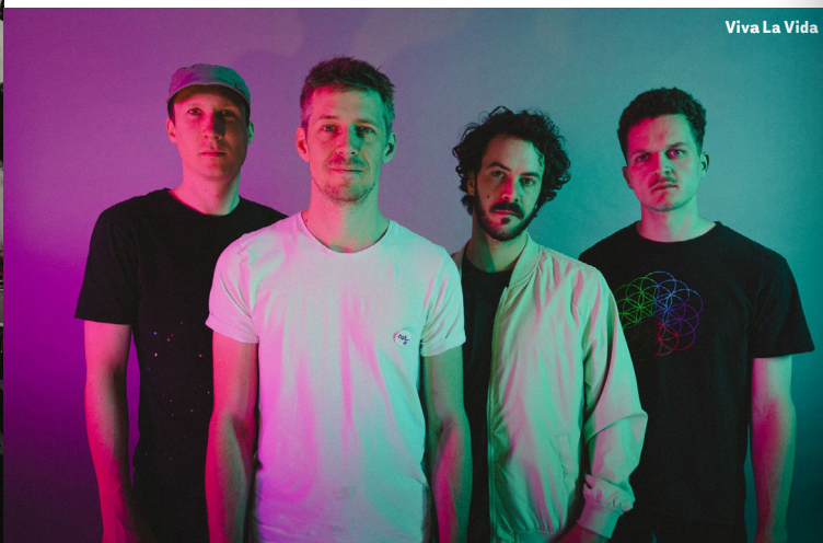
Viva La Vida

17:00 – 20:00 Uhr Back to Start - Don't stop Acoustic Project Akustikmusik 20:30 – 22:30 Uhr Pianissimo Jazz