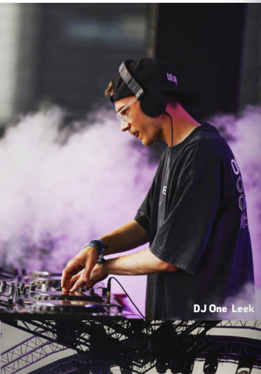
DJ One Leek