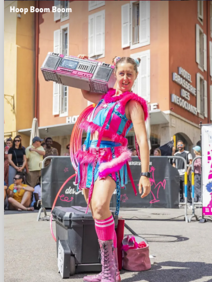
Hoop Boom Boom