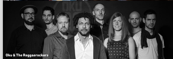
Oku & The Reggaerockers