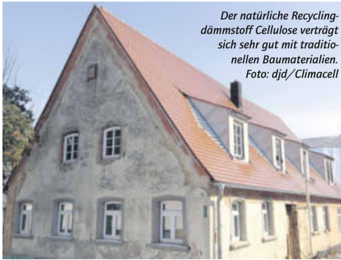
Der natürliche Recyclingdämmstoff Cellulose verträgt sich sehr gut mit traditionellen Baumaterialien.