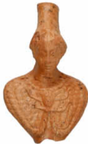
Diese Terrakotta-Statuette der römischen Göttin Minerva wurde im vergangenen Jahr ausgegraben.

»Treverorum et romanorum regionis exploratio« - übersetzt: die Erforschung der Region der Treverer (eines keltischen Stammes) und Römer. Oder kurz: Terrex. Dies ist der Name einer 2001 gegründeten kommunalen, archäologischen Grabungsgesellschaft, die sich der Entwicklung zweier archäologischer Grabungsprojekte im Landkreis St. Wendel - dem Keltischen Ringwall in Otzenhausen auf dem Gebiet der Gemeinde Nonnweiler und dem römischen Vicus »Wareswald« auf dem Gebiet der Gemeinden Marpingen, Oberthal und Tholey - widmet.