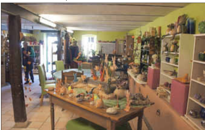
Blick ins „Kunsthandwerk TöpferCafé AllerHand“ in Nohen.