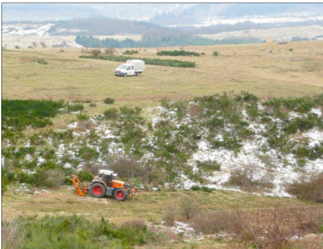
Landschaftspflege auf dem Truppenübungsplatz gehört zu den Aufgaben des Bundeswehrendienstleistungszentrums in Idar-Oberstein.

Im Rahmen der großen Umstrukturierung der Bundeswehr werden die beiden wichtigen Kasernen in Birkenfeld und Kusel geschlossen, jedoch wird der Zuständigkeitsbereich des Dienstleistungszentrums ab 2016 um die Bereiche Mainz, Wiesbaden, Darmstadt, Frankfurt und Pfungstadt erweitert. pdk