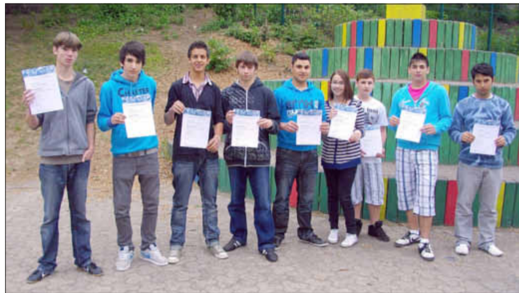
In Hörz-Grenzhausen freuen sich Jugendliche über ihren Abschluss beim Projekt Job-Fux.

www.LW-flyerdruck.de | Ihre Online-Druckerei von LINUS WITTICH