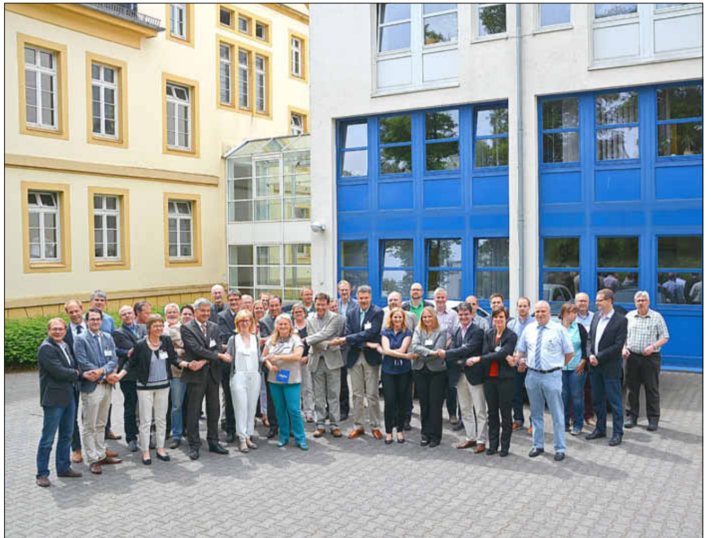
Zusammengehörigkeit präsentieren die Workshopteilnehmer vor dem Gebäude der Birkenfelder Kreisverwaltung.

zung mit dem Nationalpark zur Sprache. Die Landräte und die Bürgermeister der Nationalparkregion verstehen die Tagung als Einstieg in den gemeinsamen Prozess, um die regionale Entwicklung und das Regionalmanagement auszugestalten. pdk