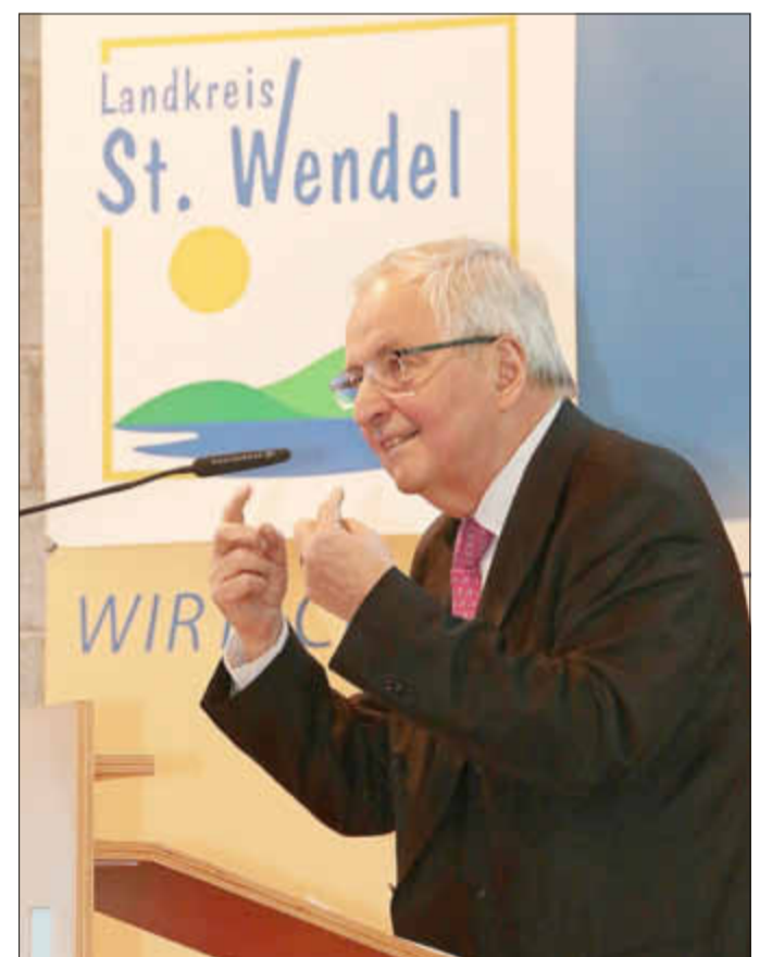
Über »Regionale Wirtschaft, globale Märkte« referierte Prof. Klaus Töpfer im Kulturzentrum Alsfassen.

lichen Regionen für die Menschen attraktiv zu halten. Attraktive Heimat, das ist für Töpfer auch ein Schlüsselbegriff wenn es um das unterschiedliche Bevölkerungswachstum in der Welt geht. Wer den Menschen in den bevölkerungsreichen, armen Ländern eine Zukunft in ihrer Heimat bieten wolle, der müsse helfen, diese Länder zu entwickeln. Hier sei das Hochtechnologie-Deutschland gefordert. Denn wirtschaftliche Entwicklung brauche als wichtigen Treibstoff Energie. Um die Umwelt nicht immer weiter zu belasten, müsse regenerative Energie zum Einsatz kommen. Deshalb hält Töpfer, von 1997 bis 2006 Exekutivdirektor des Umweltprogrammes der Vereinten Nationen (UNPE) in Nairobi, die Energiewende in Deutschland in zweifacher Hinsicht für richtig und wichtig. Zum einen senke sie den CO 2 -Ausstoß. Zum anderen müsse in Deutschland alles daran gesetzt werden, regenerative Energien billiger zu machen, so billig, dass fossile Energieträger in den Entwicklungsländern erst gar nicht eingesetzt werden. Hierzu leiste auch der Landkreis St. Wendel mit seinem »Null-Emissions-Programm« einen Beitrag. Denn hier werde beispielhaft gezeigt, wie der regionale Energiemix funktionieren könne. Das könne Vorbild sein für viele Regionen weltweit. ddt