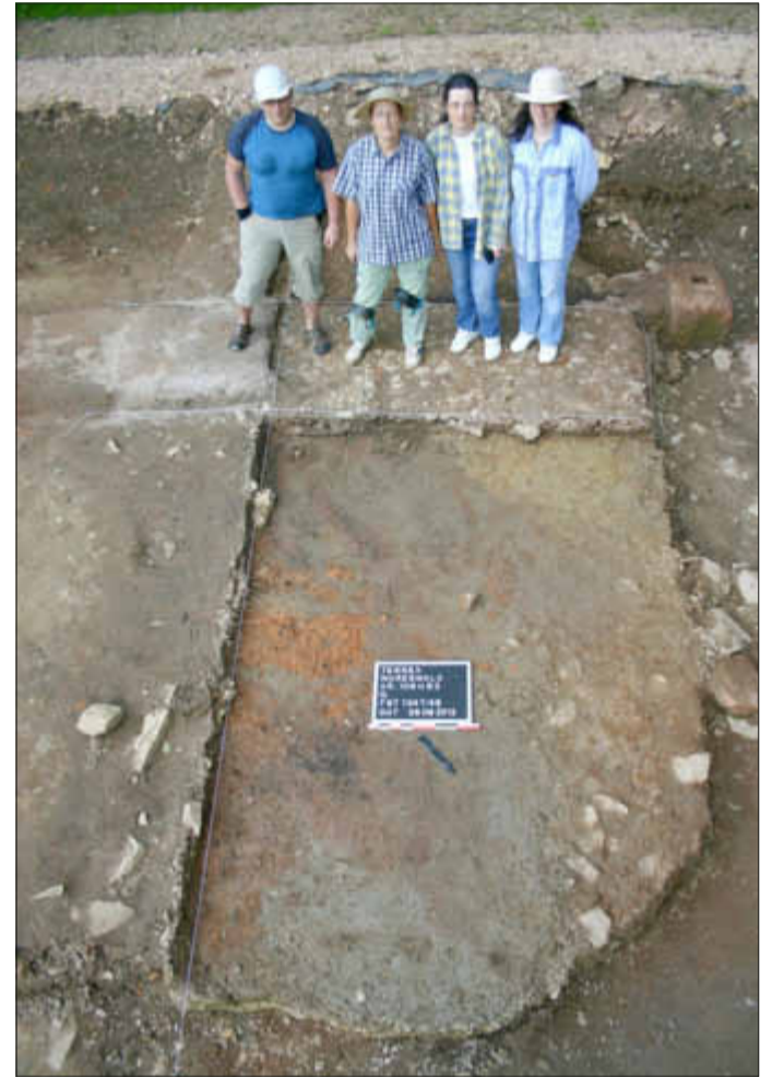
Müde, aber auch stolz auf das Geleistete, präsentieren sich diese Hobby-Archäologen.

Weitere Informationen: www.terrexgmbh.de; kp.henz@terrexgmbh.de