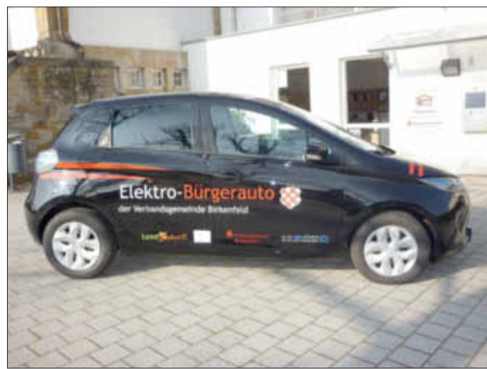
Das Elektro-Bürgerauto der Verbandsgemeinde Birkenfeld.

zunächst eine passende Organisationsform entwickelt werden. So wurde der Fahr-