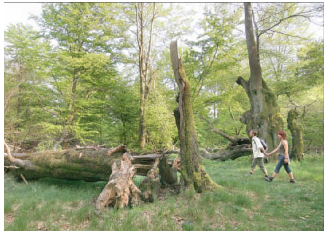
Wandern im zukünftigen Nationalpark Hunsrück-Hochwald.