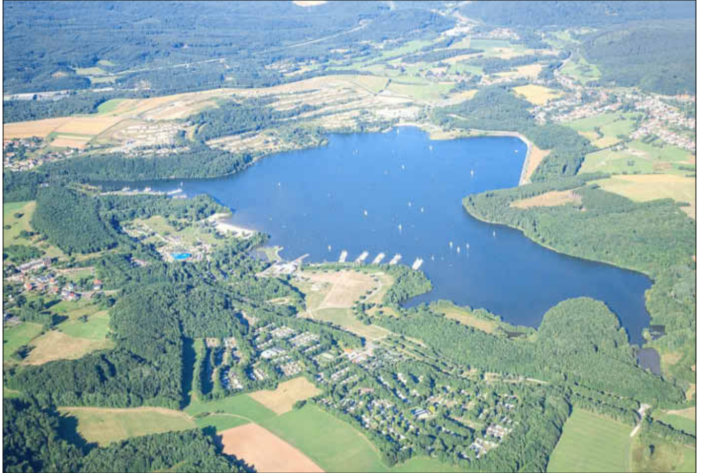
Der Bostalsee ist das touristische Zentrum im Landkreis St. Wendel.

Die historische Schiefergrube Herrenberg bei Bundenbach ist eine nicht alltägliche Attraktion an der Schiefer- und Burgenstraße. Sie vermittelt den Besuchern in eindrucksvoller Weise die Arbeit des Bergmannes und erschließt ihnen eine Welt der Fossilien aus grauer Vorzeit. Phantastische Quarzadern zeichnen im Wechsel mit graublauem Schieferge-