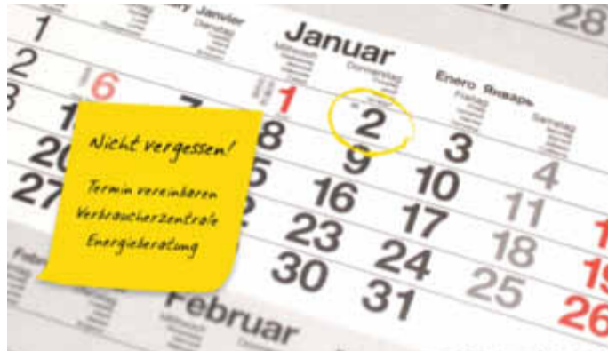
Grafik: Verbraucherzentrale Bundesverband e.V./spp-o