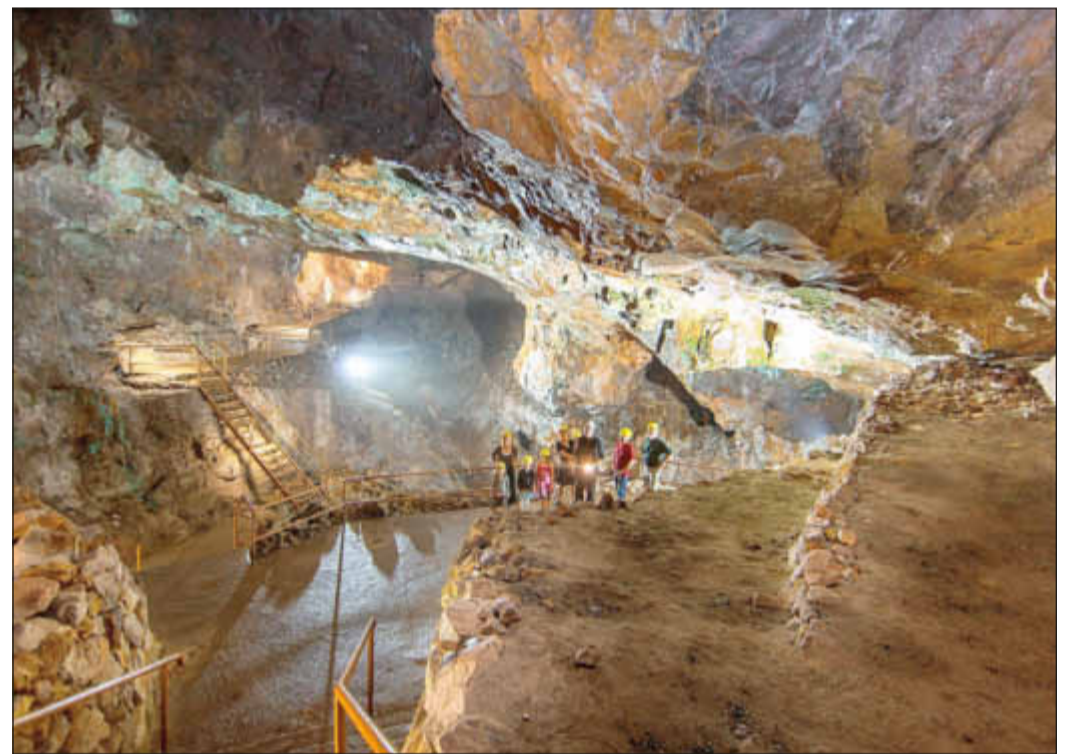
Das Kupferbergwerk in Fischbach lockt jährlich zehntausende Besucher an.

Die Karl-May-Festspiele in Mörschied sind für ihre spannende Inszenierung mit über 30 Darstellern und über 15 Pferden bekannt: Packende Zweikämpfe, pyrotechnische Spezialeffekte und aktionsgeladene Reitszenen machen die Festspiele zu einem beeindruckenden Erlebnis. Die Veranstaltung ist für mobilitätseingeschränkte Menschen geeignet. Das diesjährige Programm »Der Schatz im Silbersee« feiert am 28. Juni um 20.15 Uhr Premiere. Am 29.6. sind im Rahmen des »Familiensonntags« die Eintrittspreise ermäßigt. Alle weiteren Auführungsdaten sowie Eintrittspreise findet man unter www.karl-may-moerschied.de oder Telefon 06785-943390. pdk